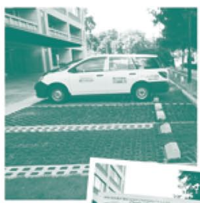
名古屋市役所 西庁舎前 駐車場の様子